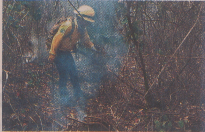
EN Othón P. Blanco, un incendio forestal se ubica a 2.8 kilómetros al suroeste del paraje Xahuayxol.